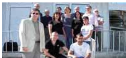
Членове на Мобилната работа с млади хора във Варна – немци и българи.

дарител, но преди всичко на експерт, партньор и източник на контакти.